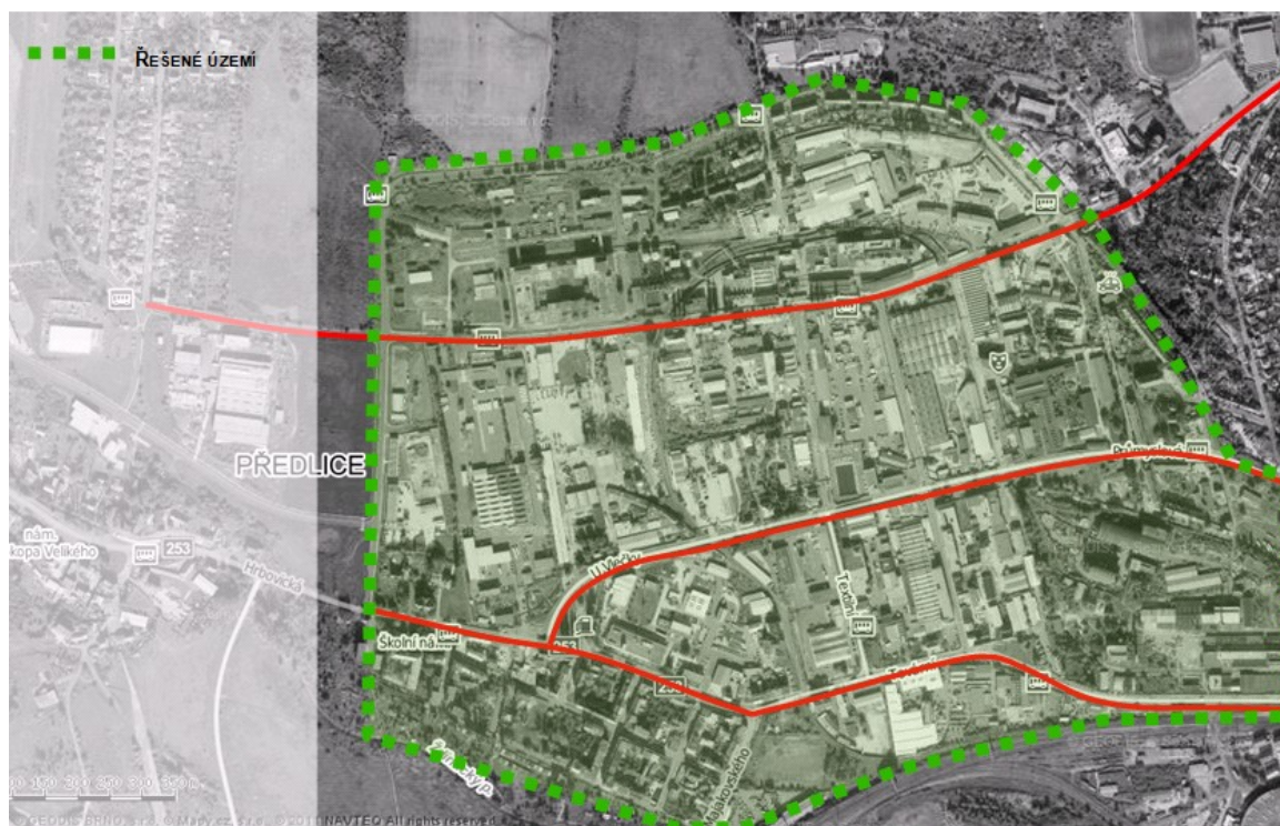
Obr. 1 – Vymezení území