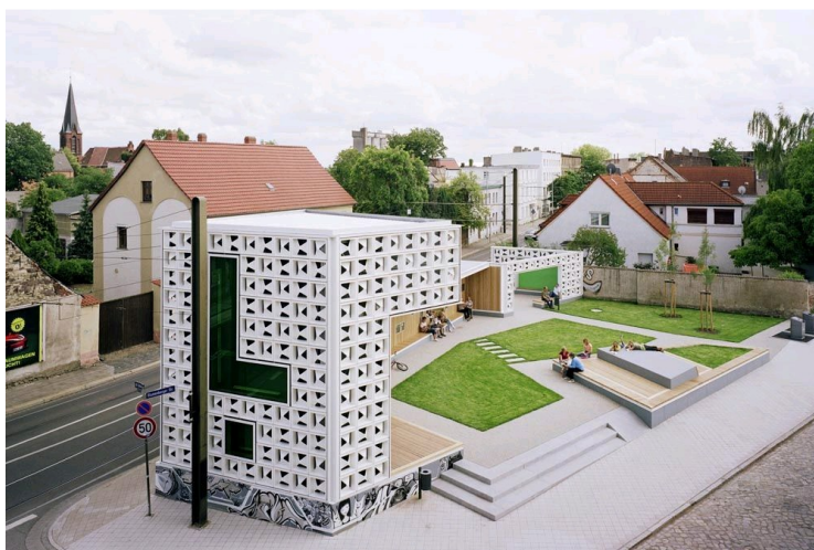
Obr. 5 – Příklad podobného kulturního centra – Magdeburg, Německo, [ www.stavbaweb.cz ]