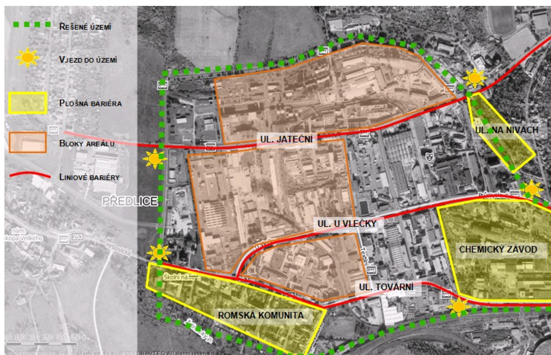
Obr. 3 – Bariéry rozvoje

V rámci splnění zadání workshopu byla dále vypracována analýza bariér, které brání současnému i budoucímu rozvoji.