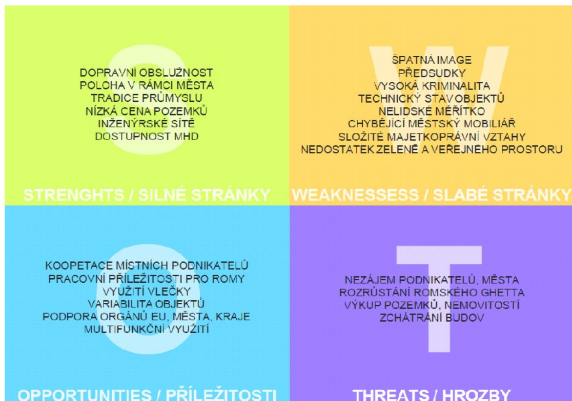
Obr. 2 – SWOT analýza

V rámci splnění zadání workshopu byla dále vypracována analýza bariér, které brání současnému i budoucímu rozvoji.