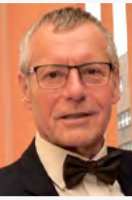
Petr Nedvědícký primátor Ústí nad Labem