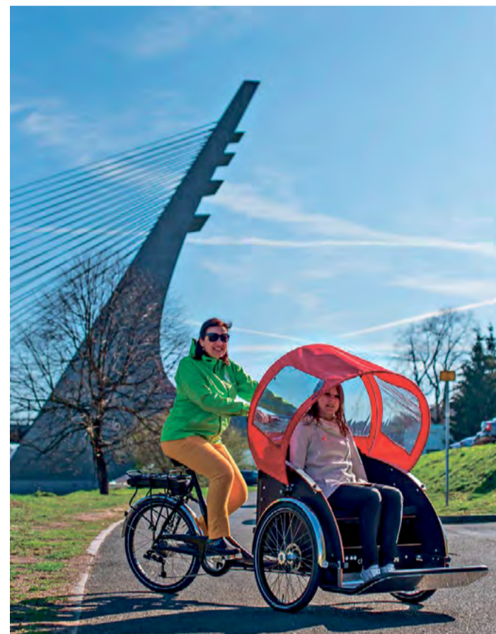
Elektrická tříkolka s dobrovolníky v sedle svezde seniory po Labské cyklostezce

Pilotní provoz ve Velkém Březně zahájí v květnu. Cyklorikša je doplněna bezpečnostními prvky včetně pásu, sklápěcí nástupní plošiny, odrazek i zvuků.