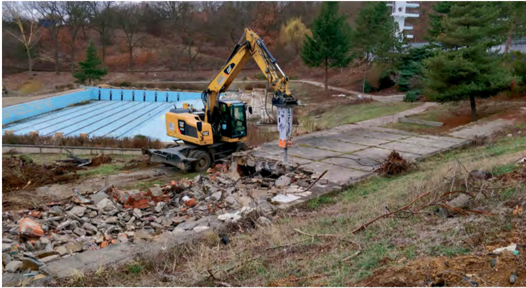
Rekonstrukce venkovní části plaveckého areálu na Klíši začala demolicí původních stavebních objektů

Rekonstrukce zahrnuje úpravu stávajících venkovních bazénů včetně okolních ploch s doplněním atraktivních prvků pro vodní hrátky. Součástí stavby jsou mimo jiné nové nerezové bazénové vany s vodními atrakcemi a bazénovou technologií, objekty ošetřovny a pokladny, terasa - paluba, brodítko, sprchy, sociální zázemí pro návštěvníky, zázemí pro plavčíky,