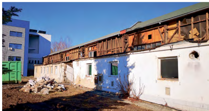
Bývalá sportovní hala – Konírna už je minulostí

Bývalá sportovní hala - Konírna u zimního stadionu už neexistuje. Na jejím místě vznikne nová ledová plocha, kterou postaví soukromý investor.