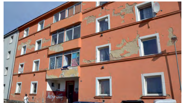
Bytový dům v ulici 1. máje bude po rekonstrukci sloužit k sociálnímu bydlení

Zastupitelstvo se záměrem zabývalo již vloni v červnu a nepřijalo usnesení. Tentokrát hlasovalo pro 27 zastupitelů. Město chce pro rekonstrukci budovy využít některý vhodný dotační titul a byty použije pro sociální bydlení.