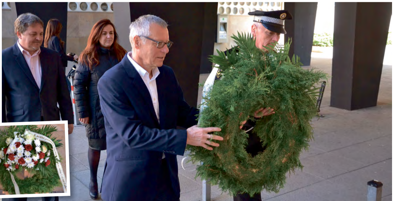
Pamětní deska obětem bombardování je umístěna na budově magistrátu v centru města, které bylo v dubnu 1945 vážně poničeno

Trvalou památkou náletů se stal gotický kostel Nanebevzetí Panny Marie. V těsné blízkosti kostela došlo k detonaci tří leteckých pum. Ty způsobily vychýlení věže o více jak 2 metry od kolmé osy. Ta je tak nejšikmější věží na sever od Alp. Čtvrtá puma prolétla střechou kostela, ale naštěstí nedetonovala.