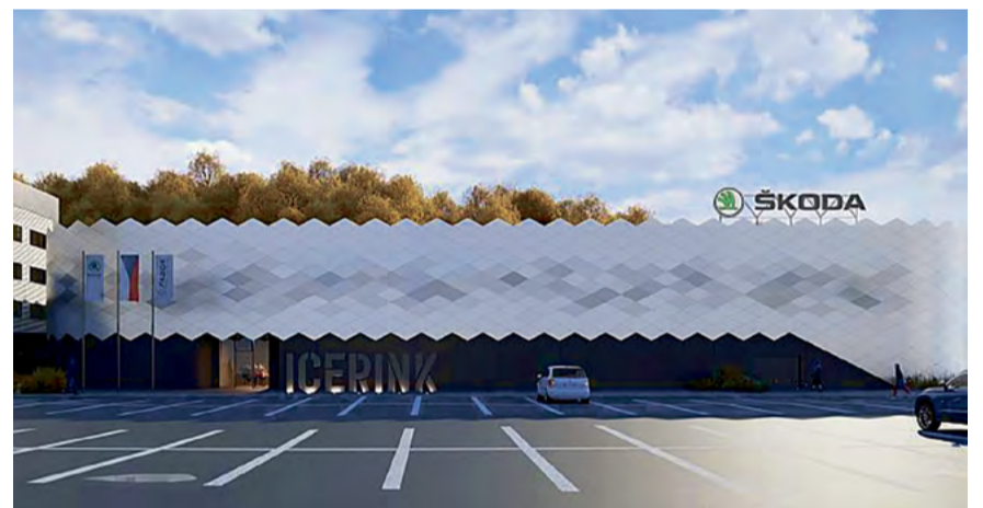
Vizualizace nové podoby sportovní haly

Občané již dříve dostali zapůjčenu tisícovku kompostérů na zahradní odpad.