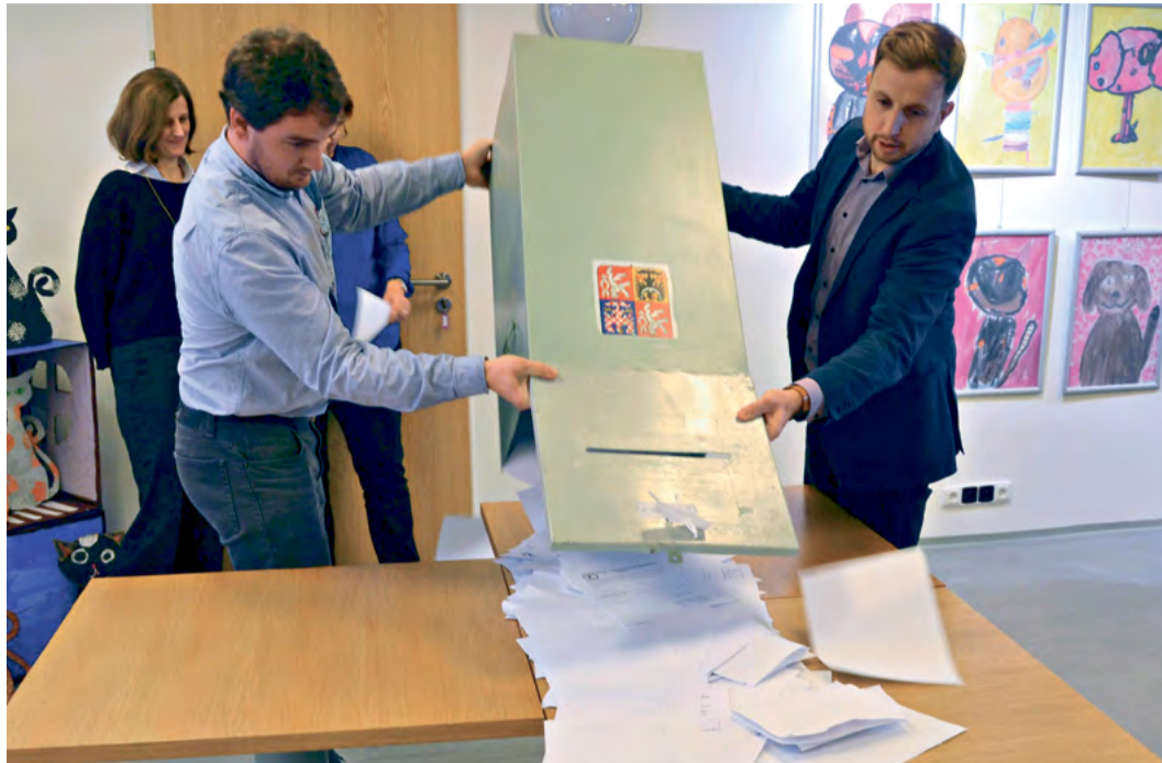
Projekt drtičů zahradního odpadu podpořil Ústecký kraj

Obyvatelé Ústí nad Labem se zároveň budou moci hlásit o další pomůcky k efektivnější