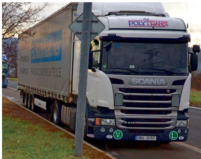
Kontejnery v průmyslové zóně jsou jedním z kroků k udržení pořádku v této lokalitě

Úklid odpadků v zeleni provádí služba VPP, kterou zajišťuje obvod – Město.