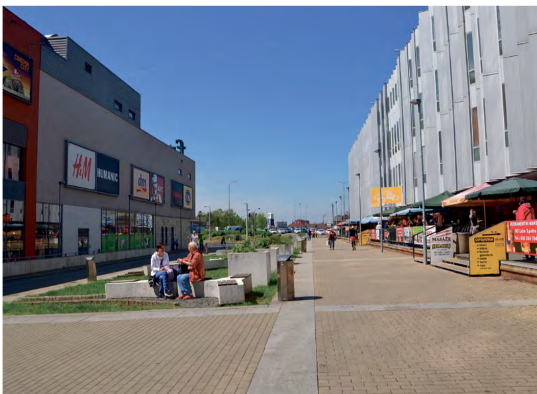
Řešení potřebuje i prostor mezi obchodními domy Labe a Forum. Před časem bylo na toto téma vypsaná i architektonická soutěž, ale žádný z návrhů nebyl realizován

Koncepce bude vypracována ve variantách řešení, s finančním omezením pro maximalistickou verzi budoucího ročního rozpočtu kanceláře ve výši 30 mil. Kč. Každá z variant bude obsahovat personální požadavky (počet a definování obsahu práce a odpovědnosti), jasně stanovené činnosti, úkoly, odpovědnosti a pravomoci, finanční náročnost na rozpočet města a právní formu. Ke každé z variant bude stanoven časový harmonogram přechodu na novou formu řízení. Každá z variant bude obsahovat své přínosy i hrozby. U každé z variant bude uveden