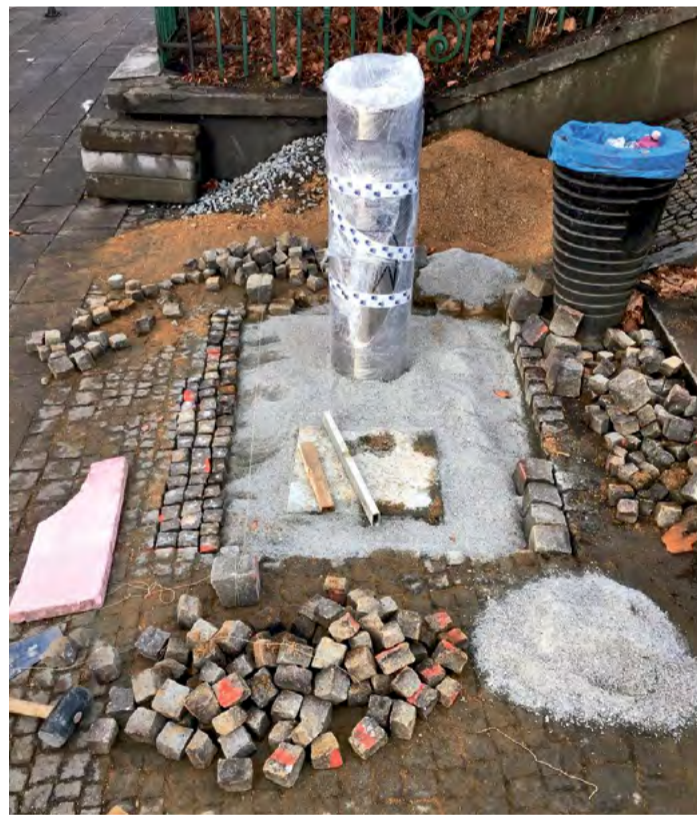
Sběrná nádoba, největší část koše, je umístěna pod zemí a má podstatně větší objem než běžné odpadkové koše v ulicích města.

Město v hledání lokalit vhodných k umístění košů pokračuje.