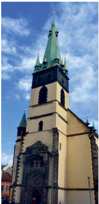
Kostel patří k nejvýznamnějším ústeckým památkám

Kostel má šikmou věž po bombardování v dubnu 1945, kdy byla zničena část městského centra. Dnes patří k nejznámějším ústeckým historickým památkám.