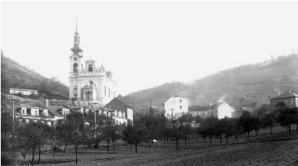
Kostel Nejsvětější Trojice v roce 1903

Před 95 lety poprvé požádaly Novosedlice a Kramoly o sloučení a současně o povýšení na město se jménem Elbenau. Postavily novou radnici, obklopenou parkem, kde je dnes pošta. Střekov byl tehdy z jedné vyloučen pro dluhy a venkovský ráz obce. Okresní úřad sloučení Kramol a Novosedlic nedoporučil, ministerstvo vnitra po dlouhé době čekání neschválilo. První světová válka tyto snahy odsunula. A tak když roku 1922 obce, tentokrát v naprostém konsensu i se Střekovem, požádaly o sloučení, bylo jim vyhověno. Celá oblast byla rozdělena na tři místní části označené římskými číslicemi pod společným názvem Střekov. Ze správního hlediska se ale stále jednalo o vesnici a její představitelé nevzdávali myšlenku na povýšení. Na ministerstvo vnitra odešla již roku 1924 další zá-