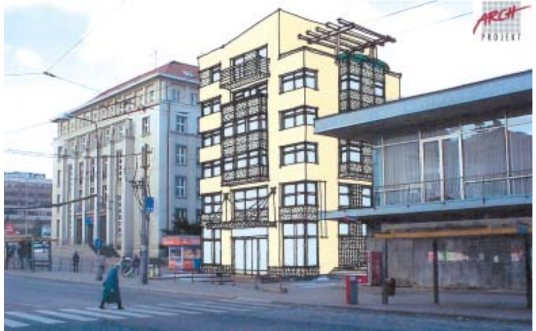
Dostavba Mírového náměstí - blok 007 - perspektivní pohled z Hrnčířské ulice. Ing. arch. Luboš Kotiš, Ing. arch. Lenka Kotišová

Objekt s nadstandardními byty a občanskou vybaveností hodlá v lokalitě Růžový palouček postavit Atelier 107, s.r.o. I této firmě město stavbu umožní prodejem příslušného pozemku.