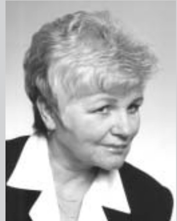
PaedDr. Květoslava Čelišová Poslankyně PS Parlamentu ČR - KSČM Dobětická 10 400 01 Ústí nad Labem