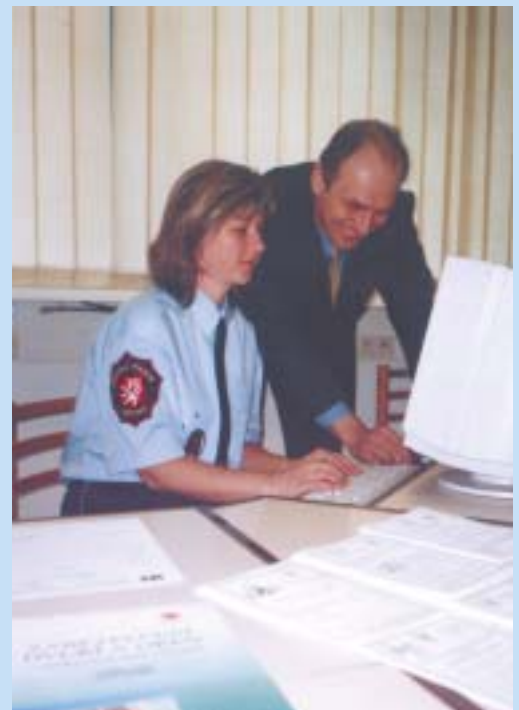
Informační středisko slavnostně otevřel primátor města Mgr. Petr Gandalovič.