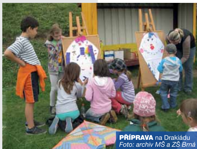
PŘÍPRAVA na Drakiádu