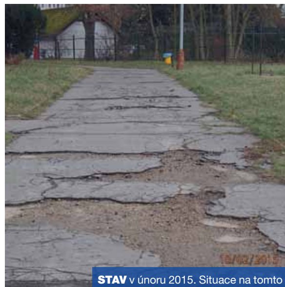
STAV v únoru 2015. Situace na tomto místě v podvečer 19. srpna 2015.