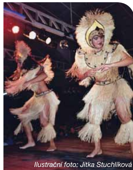
Ilustrační foto: Jitka Stuchlíková

Celá akce se koná ve spolupráci se společností Elektrowin, díky tomu ti