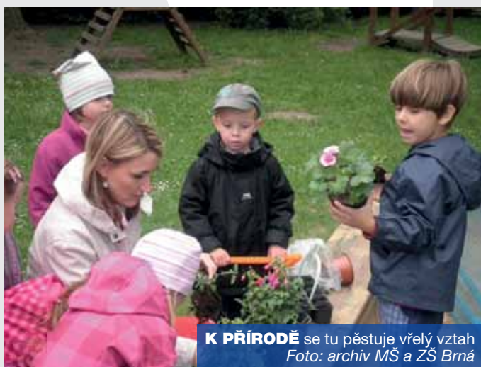
K PŘÍRODĚ se tu pěstuje vřelý vztah