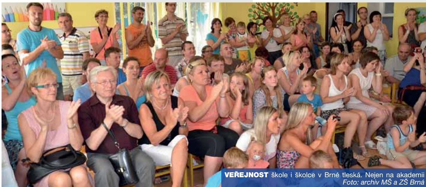
VEŘEJNOST škole i školce v Brné tleská. Nejen na akademii

Co naše žáky čeká v průběhu nového školního roku? Podzimní drakiáda