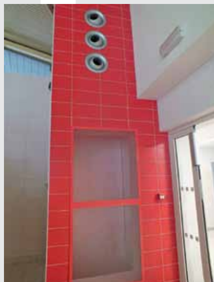
VZDUCHOTECHNIKA v provozu, tato je umístěna u bazénu