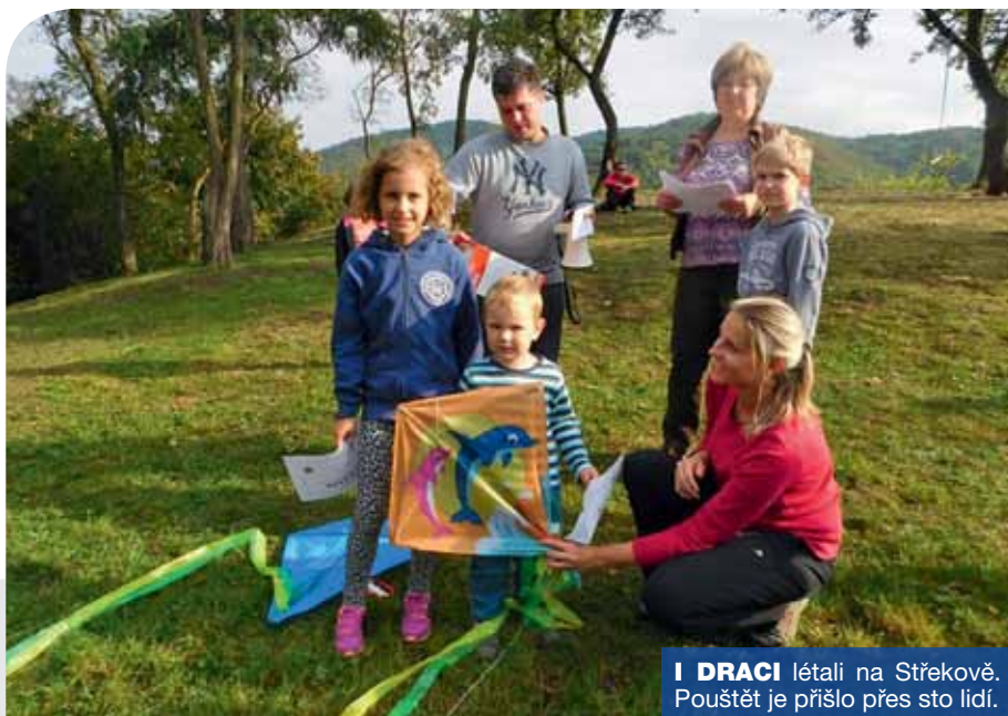
I DRACI létali na Střekově. Pouštět je přišlo přes sto lidí.

Městský obvod Střekov uvolnil v letošním roce více finančních prostředků na podporu kulturních a volnočasových aktivit jak pro své obyvatele, tak i pro všechny ostatní občany Ústí nad Labem, kteří se chtějí bavit s námi.