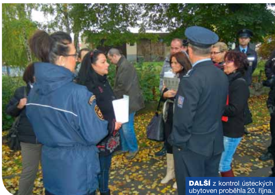
DALŠÍ z kontrol ústeckých ubytoven proběhla 20. října.