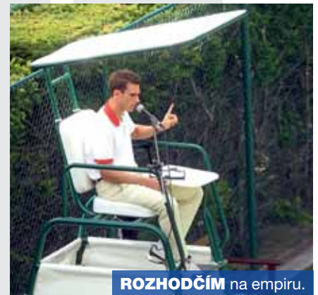
ROZHODČÍM na empiru.