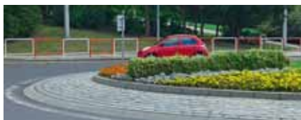
ZÁBRADLÍ u kruhového objezdu svítí novotou.

prostředky a nyní jsou nezbytné opravy nutné na mnoha místech. Bohužel není možné opravit všechny potřebné chodníky, silnice a schodiště najednou, ale podle možností a financí budeme v opravách a zvýšené údržbě pokračovat také v následujících letech tak, aby se postupně stav zlepšil a občané byli spokojeni,“ říká Renata Zrníková, starostka MO Severní Terasa.