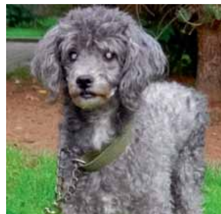
Slepý Bibinek – 13 let