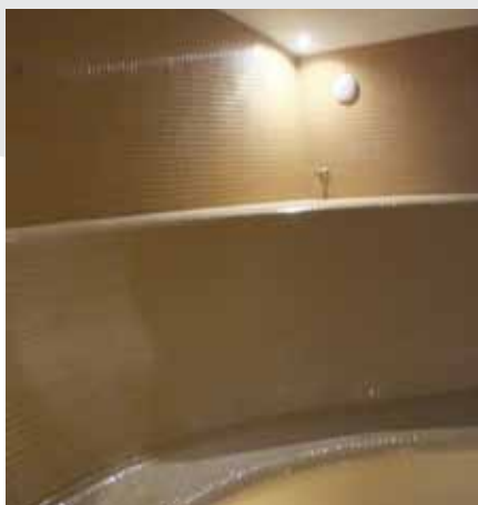
INTERIÉR SOLNÉ LÁZNĚ , v jejím sousedství je Aroma lázeň