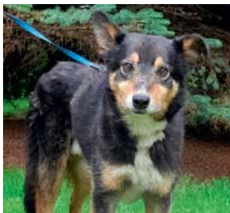
Nenáročný Kryštůfek – 12 let