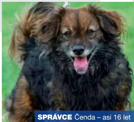
SPRÁVCE Čenda – asi 16 let

Dnes jsem se rozhodl, že vám představím nejstarší obyvatele ústeckého útulku. Jsou tu i daleko mladší adepti na nový domov, ale ti mají větší šanci, že ten nový domov jednou najdou. Bohužel nám starším ten čas ubíhá příliš rychle a tak pes nikdy neví, kolik času mu ještě zbývá na tomto světě. A také bychom chtěli prožít své stáří důstojně po boku milovaného páníčka. Pozorně si prohlédněte fotky nejstarších pejsků z ústeckého útulku a kdo umí číst ve psích