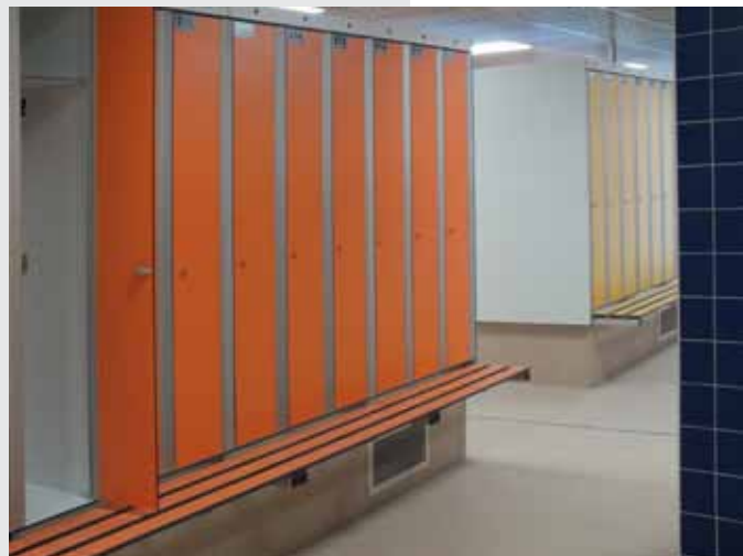
SKŘÍNKY PRO VEŘEJNOST – dohromady je jich na pět stovek