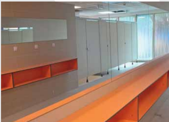
V KABINÁCH PŘEVLEKNOUT , u zrcadel zkrášlit – jsme v interiéru šaten pro veřejnost

Plavecká hala bude otevřená od šesti hodin ráno do devíti hodin večer – ranní hodiny využijí především sportovci. Pro veřejnost bude hala přístupná každý všední den od desíti hodin dopoledne. Už při vstupu se návštěvník v recepci na monitoru dozví, jaká je obsazenost saun a které dráhy v bazénu jsou vyhrazeny pro kondiční plavání. Na konci října skončí instalace informačního systému. Už na recepci návštěvníkům prozradí jak šipky, tak velká informační tabule, kde co v hale naleznou.