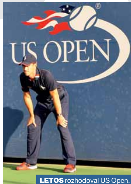
LETOS rozhodoval US Open.

Nejen mezi tenisty, ale i mezi tenisovými rozhodčími je velká konkurence. „Mezinárodní licence má několik stupňů. Já mám zatím bílý odznak, následují bronzový a stříbrný. Nejvyšší je zlatý odznak, jehož držitel musí nejen prokázat správná řešení situací na dvorcí, ale rovněž bezchybně zvládnout televizní a finálová utkání velkých turnajů“, přibližuje