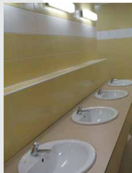
ŠATNY A ZÁZEMÍ PRO SPORTOVCE jsou laděny do žluta a modra