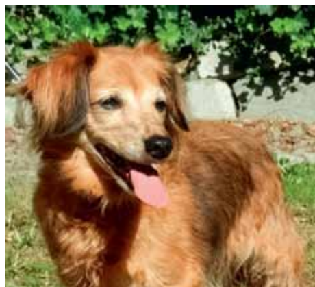
Beginka zvaná Babulka – 13 let