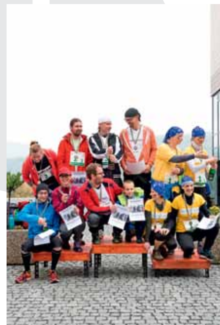
STŘÍBRNÍ, zlatí a bronzoví (zleva) ve štafetovém běhu.