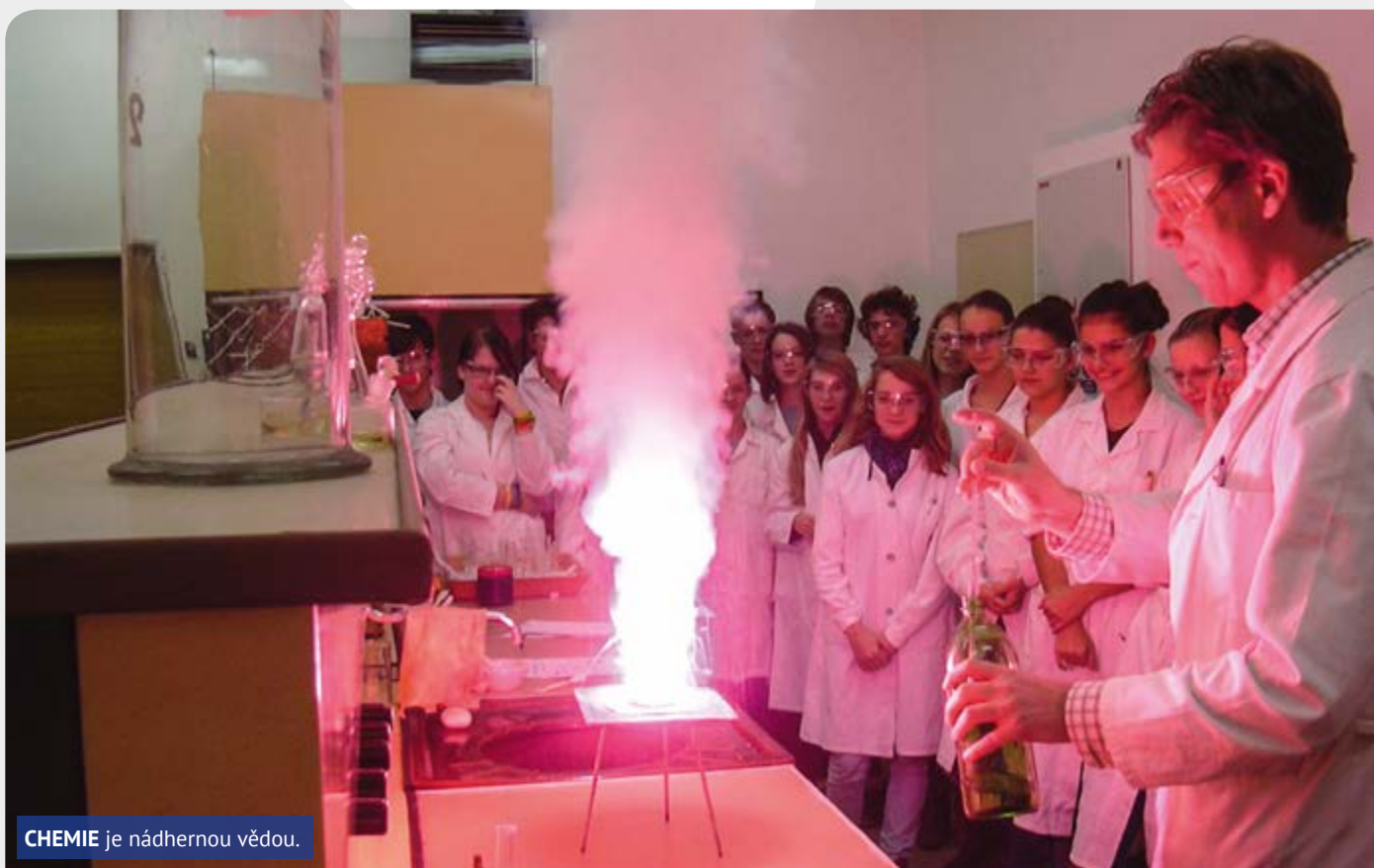
CHEMIE je nádhernou vědou.

GYMNÁZIUM A STŘEDNÍ ODBORNÁ ŠKOLA DR. VÁCLAVA ŠMEJKALA SE PŘEDSTAVUJÍ.