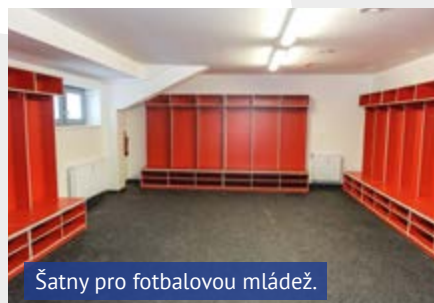
Šatny pro fotbalovou mládež.

Více než stovka atletů (nejmladší jsou šestiletí, nejstarším je přes třicet) se už do dresů nemusí oblékat doma, ale až na stadionu. Atleti mají konečně možnost osprchovat se hned po trénincích na lehkootletickém oválu. A (po doladění některých technických záležitostí) v zimním období, než vyběhnou ven, začít tréninkovou jednotku tak, jak se má – totiž řádným protažením těla v krytém prostoru. Další tři nové šatny jsou vyhrazeny pro mládež FK Ústí nad Labem. Počet ma-