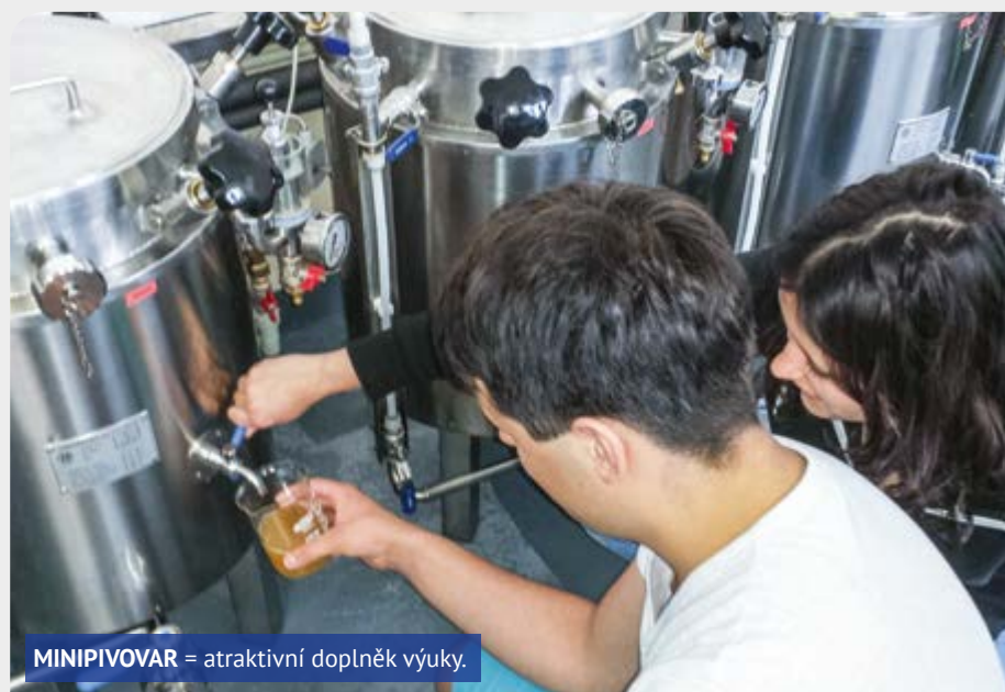
MINIPIVOVAR = atraktivní doplněk výuky.

tovců a pomoci jim zvládat vysoké nároky sportu i vzdělávání na střední škole. Proto si sportovci mohou žádat o individuální vzdělávací plán tak, aby mohli bez problému trénovat i chodit do školy.