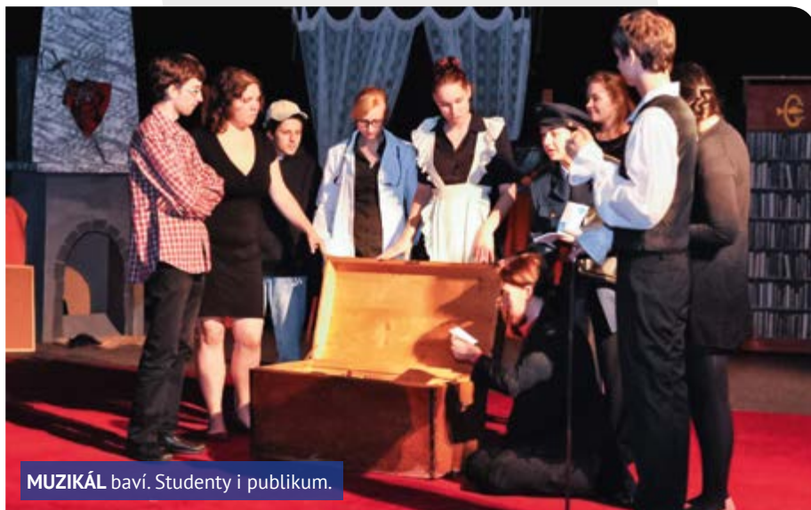
MUZIKÁL baví. Studenty i publikum.

Možná je to odvážné tvrzení, ale chemie je nádhernou vědou. Přestože se dnes v každodenním životě nedokážeme bez chemie obejít, tak samotná výuka chemie se netěší velkému zájmu. To je velká škoda. Vždyť všichni jíme, jezíme autem, koukáme na televizi, pracujeme na počítači, občas potřebuje-