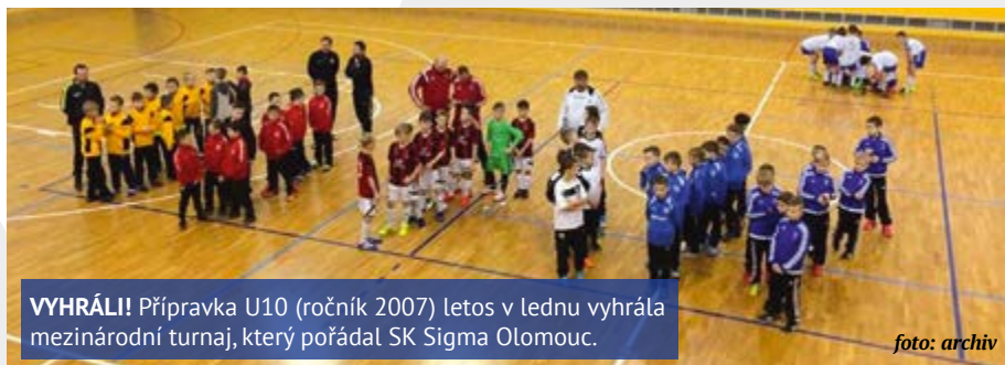
VYHRÁLI! Přípravka U10 (ročník 2007) letos v lednu vyhrála mezinárodní turnaj, který pořádal SK Sigma Olomouc.

V České republice, jak mi řekl pan Bechyně, patří naše centrum k nejlepším. Mladých fotbalistů a také fotbalistek každoročně přibývá. Letos jich je evidováno v informačním systému České unie sportu víc než pět set. Děti jsou přijímány do fotbalových přípravků od pěti let. FK Ústí – mládež má celkem 15 týmů – 3 dorostenecké, 6 žákovských a 6 přípravků. Turnaje, zápasy a akce mladých fotbalistů jsou součástí kulturního a sportovního života v Ústí nad Labem. Fotbalový klub mládeže – sportovní centrum dlouhodobě spolupracuje s klubem GS Dynamo Dresden. Spolupráce vyústila v projekt přeshraniční spolupráce. Z peněz získaných z EU se financují společné tréninky, jazykové kurzy pro hráče, přátelská utkání a mnoho dalších. Rovněž spolu-